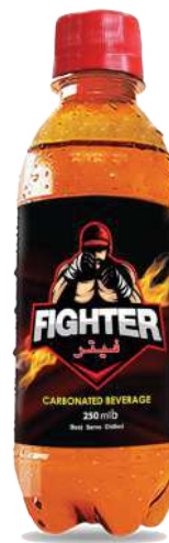
Fighter Energy Drinks 250ml