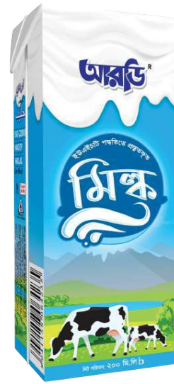
UHT Milk 200ml Brick Pack