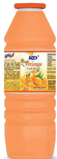
Orange Drinks 150ml