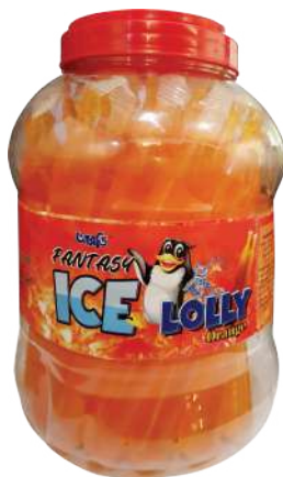
ICE Lolly Orange & Mango 30pcs/Jar