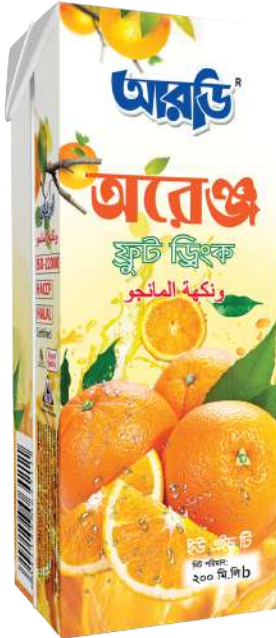
Orange Fruit Drinks Smart 200ml Brick Pack