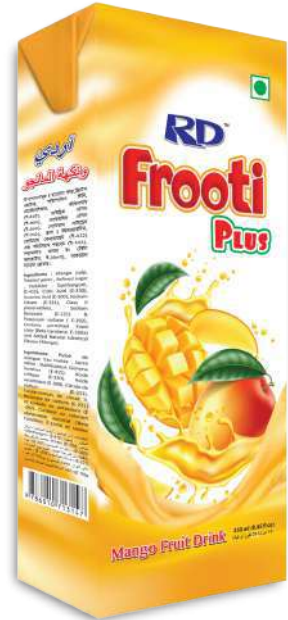
Mango Fruit Drink Smart 200ml Brick Pack