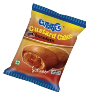
Chocolate Cake 13gm