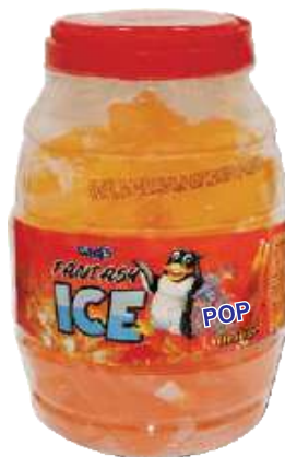
ICE POP-Mango 30pcs/Jar