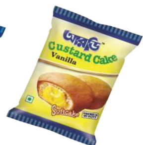
Vanilla Cake 13gm