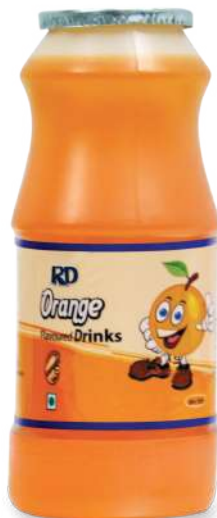
Orange Drinks 170ml