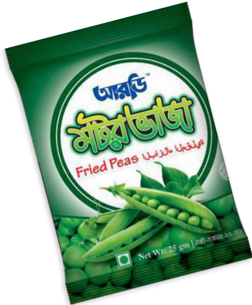
Fried Motor 25gm