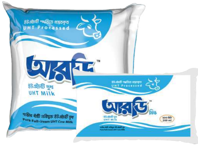
UHT Milk 500ml & 200ml Poly Pouch