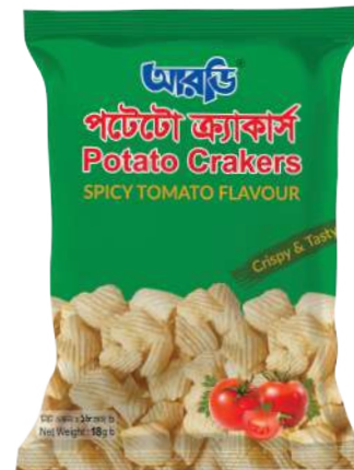
Potato Crakers 18gm