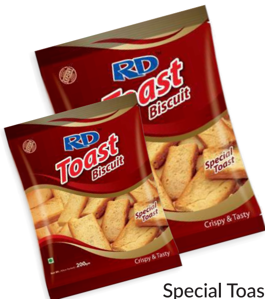
Special Toast Biscuit 350gm & 200gm