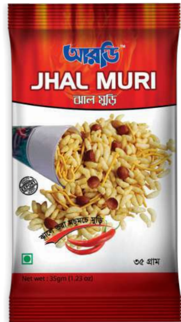
Jhal Muri 35gm