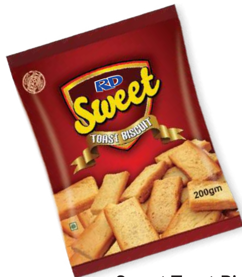
Sweet Toast Biscuit 200gm