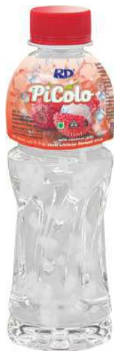
Picolo 250ml Float with Coconut Jelly