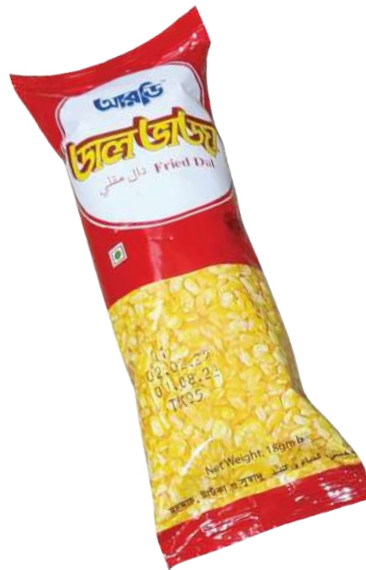
Fried Dal 18gm