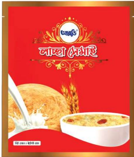
Laccha Semai 200gm