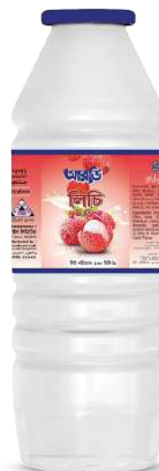
Litchi Drinks 150ml