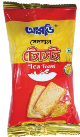
Special Tea Toast Biscuit 24gm