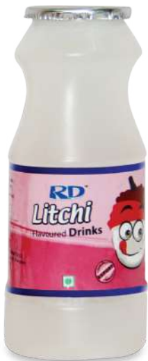
Litchi Drinks 170ml