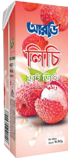
Litchi Fruit Drinks Smart 200ml Brick Pack